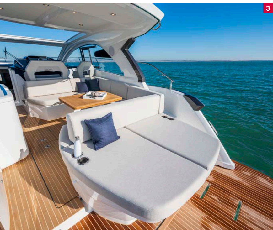
3 De open kuip van de Beneteau GT 41, met midscheeps de stuurstand. 4 De gastenhut onder de kuipvloer van de Beneteau GT 41.

Onder het achterste gedeelte van de kuipvloer is de motorruimte ingericht, met in onze testboot twee Volvo Penta D4 diesels van 300 pk met hekaandrijving. Op de stuurstand hebben we de beschikking over de optionele Volvo Driving Joystick, waarmee we behoedzaam van de ligplaats kunnen sturen richting de havenmond. De zee is vandaag best ruw, daar zullen we onze vaartest enigszins op moeten aanpassen. Tot zo'n 23 knopen blijft het comfortabel aan boord en gedraagt de boot zich voortreffelijk. Laten we